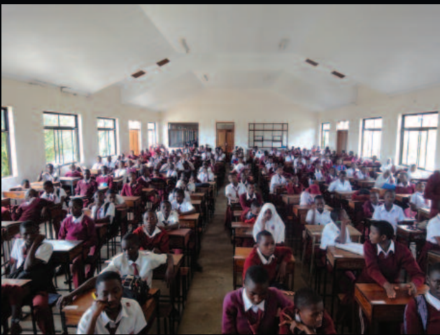
Zaidi ya wanafunzi 120 wa kidato cha pili wakijiandaa kufanya mitihani ya majaribio katika shule ya sekondari huko Mwanza, Kaskazini-Magharibi mwa Tanzania.

Pamoja na ukweli kwamba Serikali ya Tanzania imewekeza kwa kiasi kikubwa katika elimu, bado inahitaji kufanya jitihada zaidi. Human Rights Watch inatoa wito kwa Serikali ya Tanzania kuondoa sera zinazokiuka haki ya kupata elimu, kuandaa na kutekeleza mipango ya kuondokana na vikwazo vinavyowafanya vijana kukosa shule na kuweka msisitizo katika kuboresha elimu katika shule ambazo zina ubora duni nchini kote.