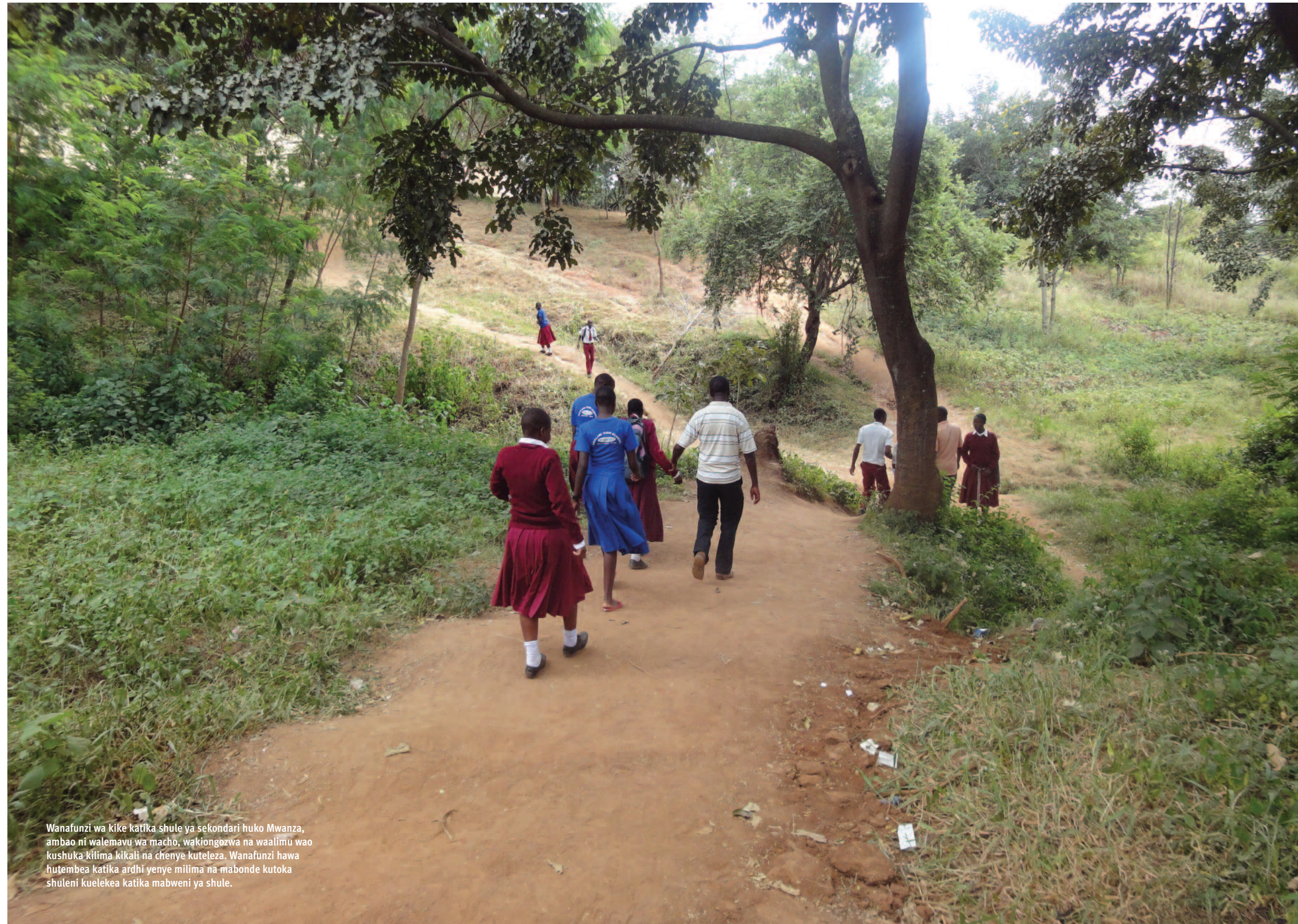
Wanafunzi wa kike katika shule ya sekondari huko Mwanza, ambao ni walemavu wa macho, wakiongozwa na waalimu wao kushuka kilima kikali na chenye kuteleza. Wanafunzi hawa hutembea katika ardhi yenye milima na mabonde kutoka shuleni kuelekea katika mabweni ya shule.