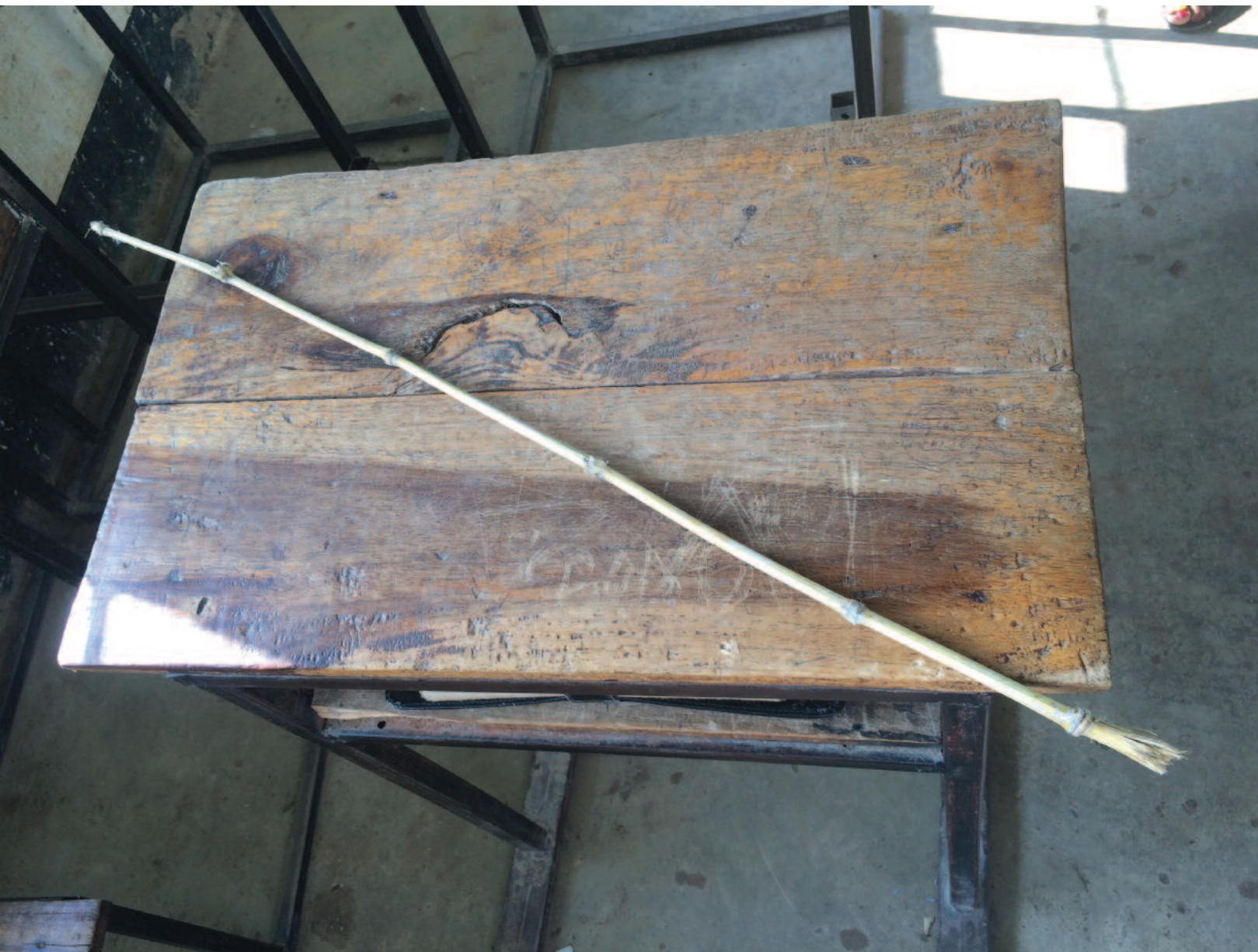
Fimbo ya mianzi ambayo hutumika na walimu kuchapa wanafunzi darasani ikiwa juu ya dawati katika shule ya sekondari huko Mwanza, Kaskazini-Magharibi mwa Tanzania. Human Rights Watch waligundua kwamba walimu wengine huwachapa wanafunzi na fimbo au hata kwa kutumia mikono yao au vitu vingine.

za uendeshaji wa shule. Awali, ada hii ya ziada ilikua kigezo cha kujiunga na elimu ya sekondari ya kidato cha nne nchini. Kwa mujibu wa serikali, uandikishaji katika shule ya sekondari umeongezeka baada ya kufuta ada.